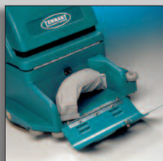
Facil acceso al filtro de la bolsa