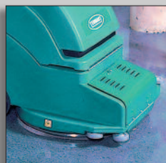
Diseño de cabezal flotante