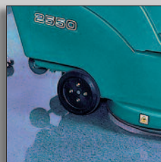
Grandes ruedas de transporte