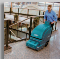
Maquina en acción